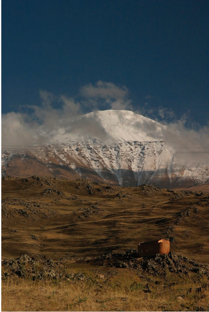
Greenpeace üyeleri tarafından sembolik olarak yapılan Nuh'un Gemisi ve Ağrı Dağı, kuzeyden (Korhan Yaylası)