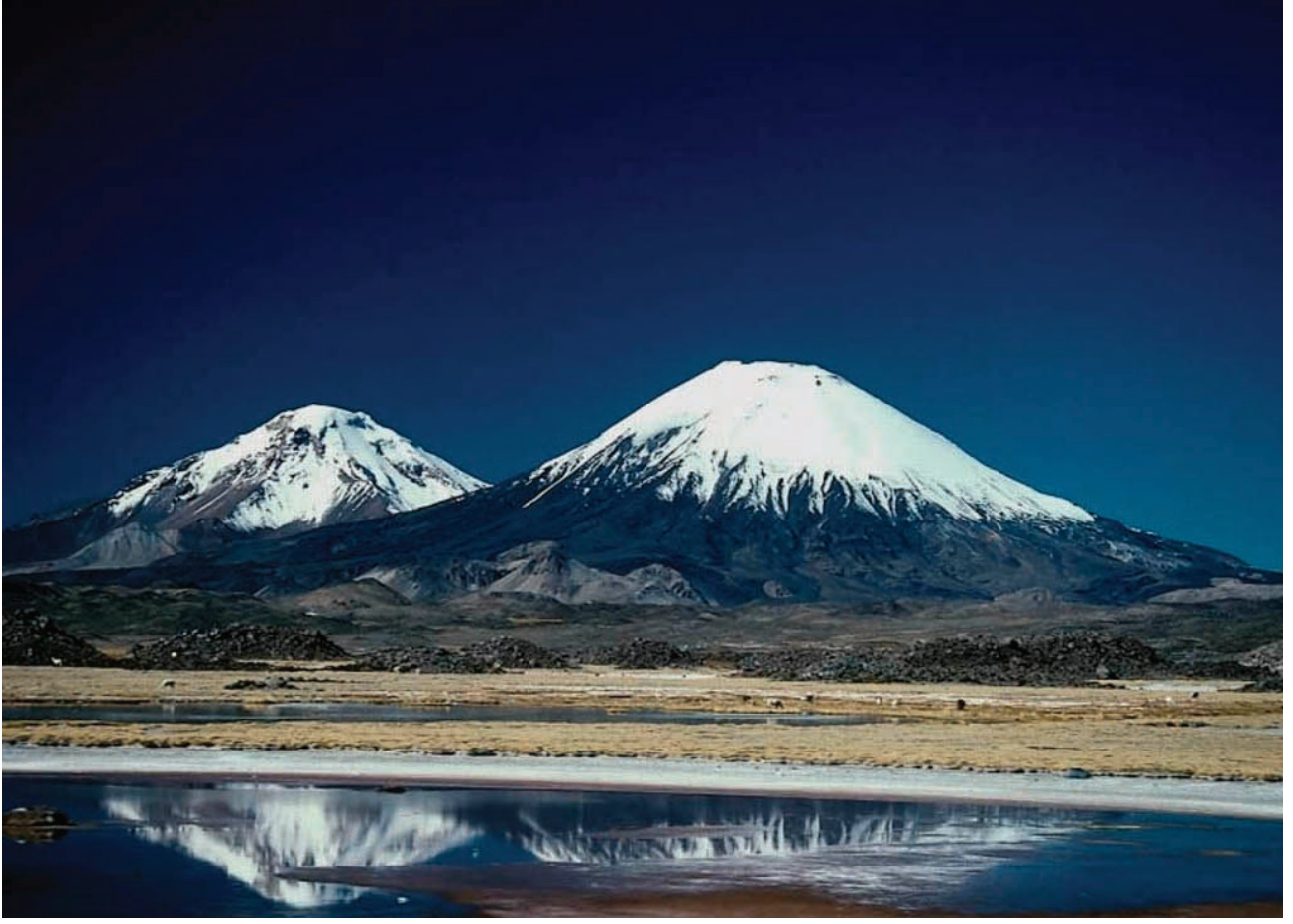
Büyük ve Küçük Ağrı

Uluslararası arenada haklı bir üne sahip olan ilimizin tarihi, doğal ve kültürel değerlerinin gelecek kuşaklara taşınması noktasında bilimsel toplantılar oldukça önemlidir. Burada ortaya konulacak dilek ve öneriler ışığında önceliklerimizi gözden geçirme, yeni planlamalar ve düzenlemeler yapmada bilimsel veriler bize rehberlik edecektir. Bölgesel kalkınma konusunda uzman görüşler ışığında ilimizin diğer illerle her alanda rekabet edebilir duruma gelmesi için ortaya konulacak veriler oldukça önemlidir. Tarım, hayvancılık ve turizm açısından cazibe merkezi olacak kaynaklara sahip ilimiz, bu kaynakların verimli kullanımı noktasında çitayı yüksek tutmak zorundadır. Bugün kaybolmaya yüz tutan kültürel değerlerin yeniden canlandırılması, hem ilin kültürel dokusu hem de kültürel değerlerin canlandırılması açısından büyük öneme sahiptir.