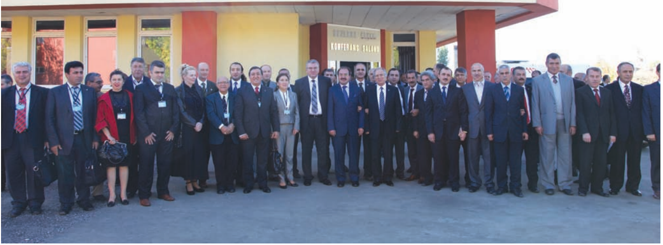
III. Uluslararası Ağrı Dağı ve Nuh'un Gemisi Sempozyumu'na Katılanların Toplu Hatıra Fotoğrafı

Bence bir şehirde yaşıyor olmanın, ona katılıyor bulunmanın, şehri katılmaya değer bulmanın en somut anlamı budur. Şehirlerin ruhundan bahsedilir. Onlara ruh veren şey herhalde onu çevreleyen coğrafi iklime irca edilemez. Şehir içerden ve dışarıdan kuşatmasına rağmen tabii dekor kendi başına şehirlere ruh veriyor olamaz. Belki silüetini belirler. Bu iklimi şehir için seçen ve şehri bu iklime kendine göre uygulayan, “dekore” eden insan ruhudur. Şehrin insanların ruhunda ne varsa, şehrin âfâkında da vardır. Yahut şehrin âfâkını insanların ruhunda olan karartır veya aydınlatır.